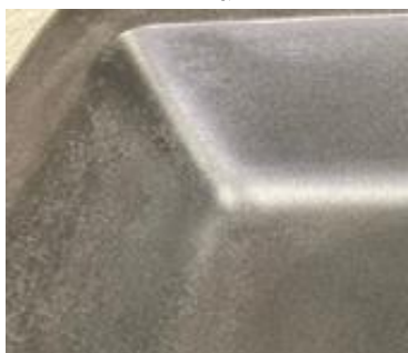
※セメント成型時に起因 による塗装ムラ