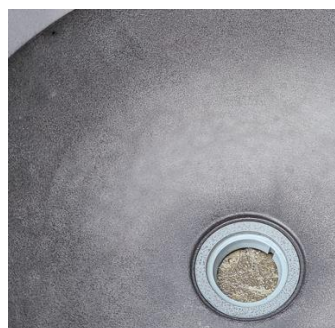
※セメント基材による乾燥収縮影響 塗膜水紋:乾燥後に見えなくなります