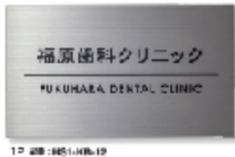
12 型 KB-12