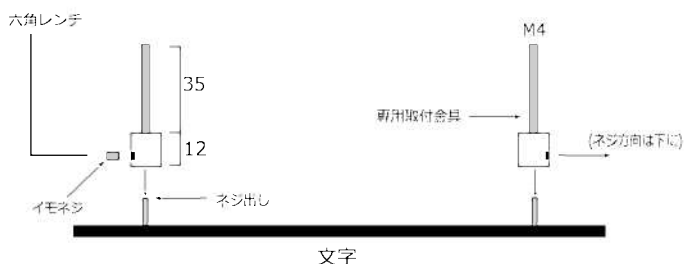
図① “専用取付け金具の構造図”

専用取付け金具は、梱包の時点で装着済みです。図1.の様にイモネジを締めることで本体ネジ出しと結合されています（施工後簡単に着脱可能です）