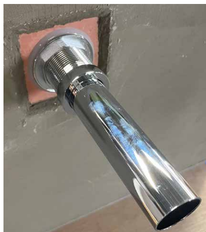
〈屋内設置時の裏面参考写真〉