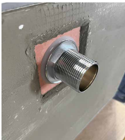
〈屋外設置時の裏面参考写真〉